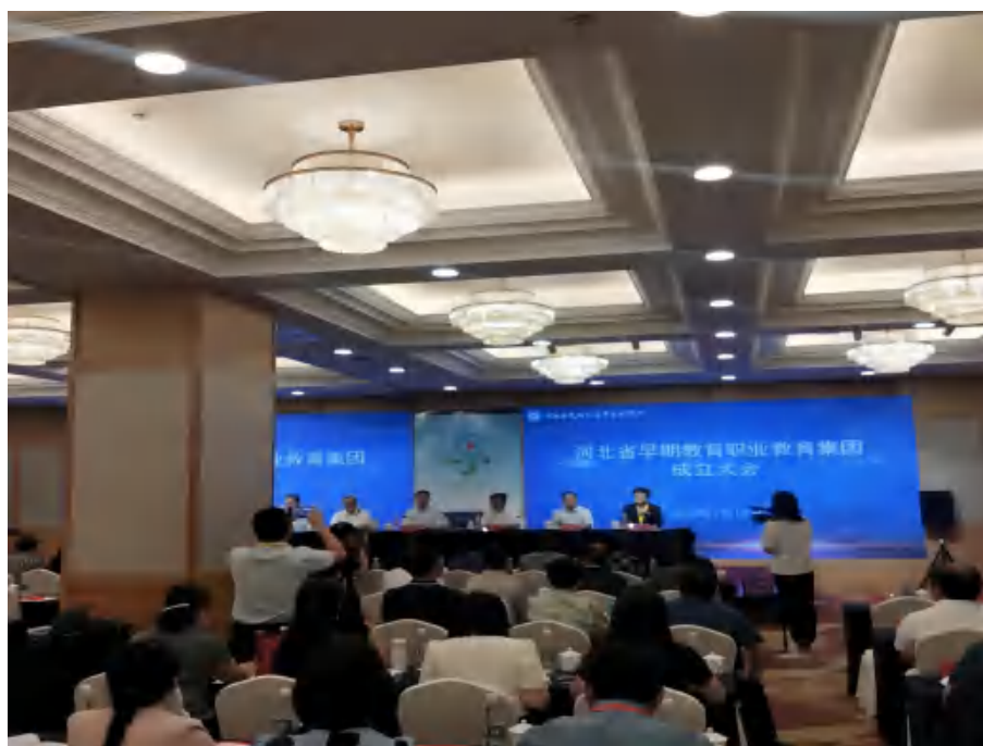
图 19 河北早教集团成立大会

专业共建机制。利用社会优质资源，校企合作共办专业，解决学校办学专业师资实践经验不足、课程建设滞后幼教事业发展、学生实习就业单位不稳定等问题。与沧州启航幼儿集团等共办早期教育专业。