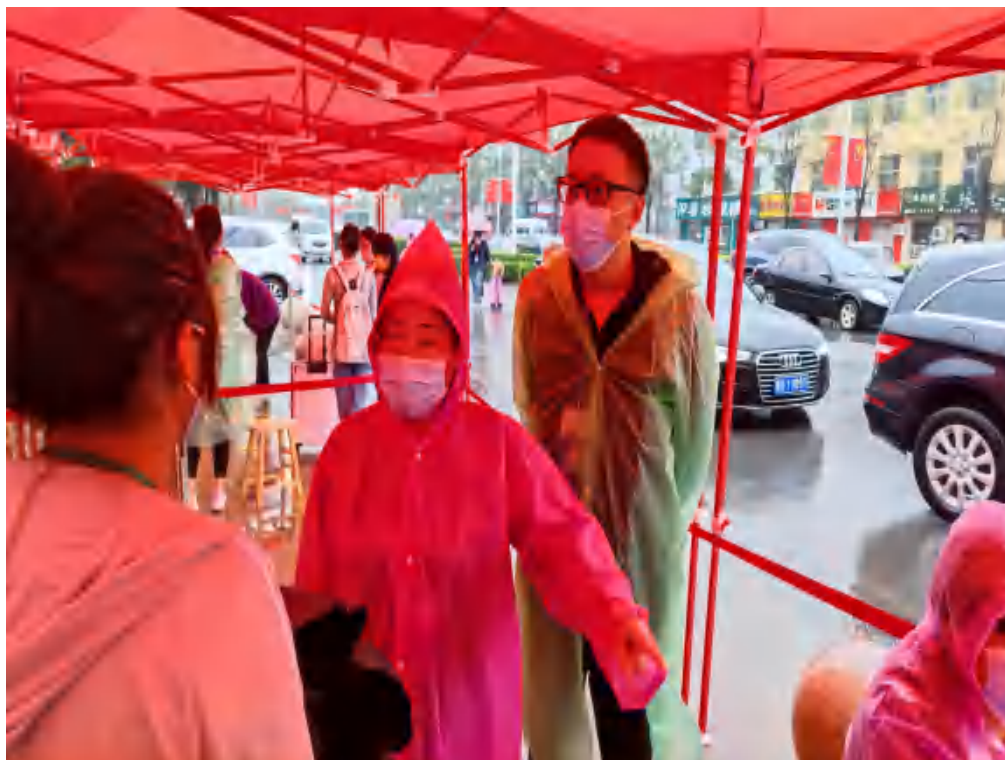
图 11 疫情期间学校返校教师服务队

返校学生按照预先制定的错峰安排，陆续抵达学校门口。报道现场，学生们佩戴口罩，在工作人员指引下，完成查验 48 小时内核酸检测阴性证明、健康码核验、体温检测等程序有序进入校园。整个流程有条不紊、井然有序。