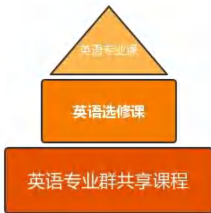
图 14 英语专业课程建设图

围绕专业群课程建设，学校提出：“四、三、一”工作法，即“系部、专业、学科组、教师四位一体，协同课程建设；“调研、比较、分析”三步工作法，明确不同专业岗位典型任务所需的素养、知识、能力异同、明晰专业群教学共建共享任务，明白不同专业教学的侧重；以“学生中心、产出导向、持续改进”为中心理念，促进专业群课程共享