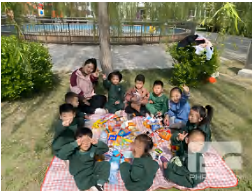
图 17 学生幼儿园实践

4月20日，教育部职成司委托职业技术教育中心研究所线上形式组织召开《职业学校学生实习管理规定》政策解读专题培训会议。学校主管校领导，教务处、各系部负责人，实习指导教师均参加了本次线上会议。学校上下将严格落实会议精神，在学校内部开展二次培训，按照《规定》要求，严格规范学生实习工作，坚决守住底线，不触碰任何红线，保障学生实习工作的高质量、高水平和高成效。