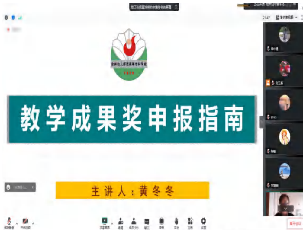
图 16 第四十二期职教大讲堂