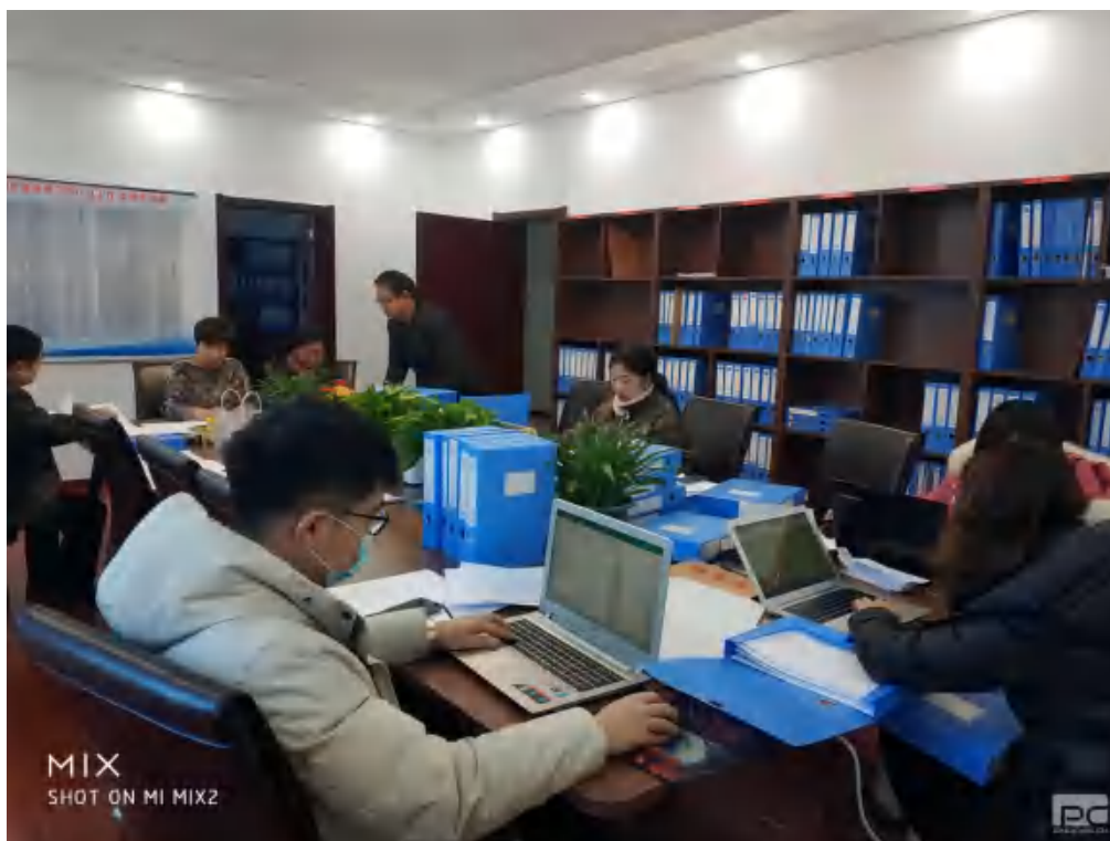
图 32 二级认证材料归档

教学督导中心对组档工作做了详细的程序安排和人员分工。每天上班后，首先给每一位员工布置好当天的任务，然后大家各就各位，开始工作。教学督导中心老师们忙着整理资料架，查找资料，查对一级指标和资料名称、贴标签等事情，也是忙忙碌碌。学前教育系的老师们大都是年轻教师，大家都全神贯注地工作，只能看到大家取资料、放资料的忙碌身影，听到键盘输入文字和笔在纸上写字的声音。