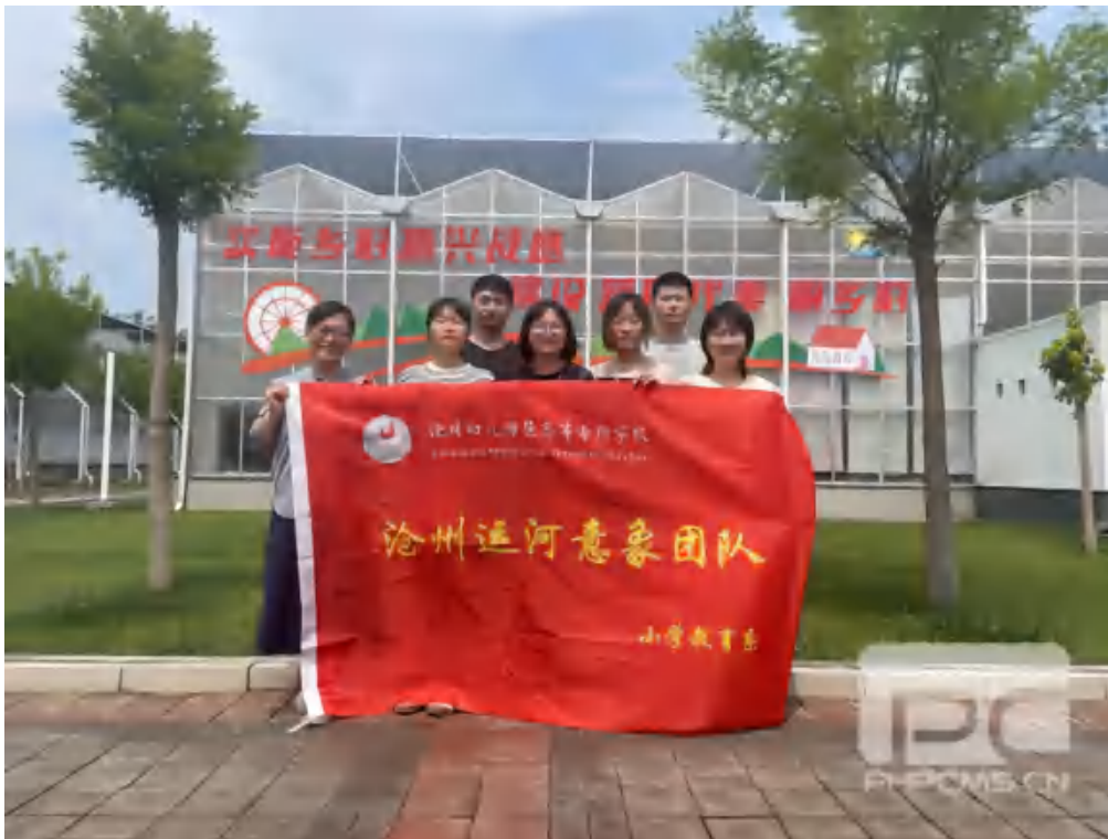
图 10 大学生暑假课创活动之农业基地