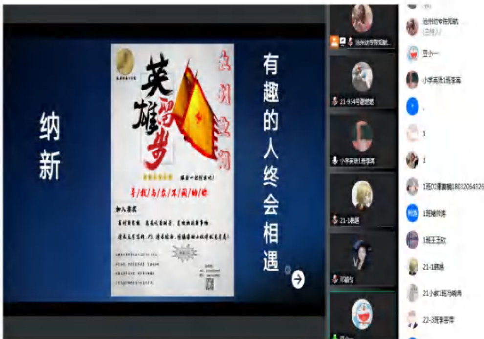
图 4 非遗传承·薪火相传 1

创新是引领发展的第一动力，科技创新与科学普及是实现创新发展的两翼。为贯彻落实沧州市科学技术协会开展的 2022 全国科普日系列活动的要求，进一步宣传沧州幼儿师范高等专科学校在科技创新领域的优秀成果，小学教育系于 2022 年 9 月 21 日晚 19:00—20:15 举办以“薪火相传·非遗文化”为主题的科技周研讨会。研讨会以腾讯会议的方式开展，由“沧有乔木”团队指导老师陈知航主持，小学教育系近 300 人参加会议。