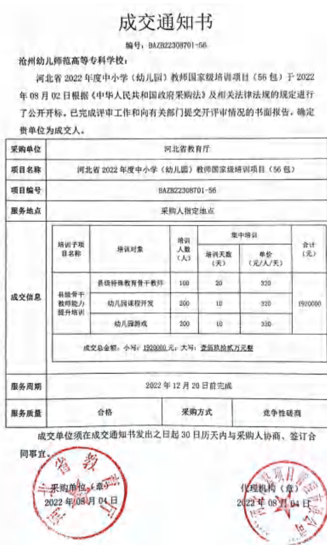
图 26 国培中标通知

此次中标，是学校历史上首次获得国家级培训项目的承办资格。学校将严格按照“国培计划”项目要求，高质量、高标准的做好本次国培工作，树立沧州幼专的优质形象。