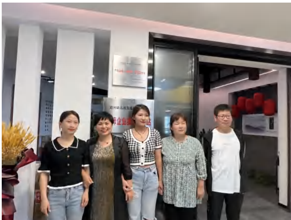
图 22 教师入企实践

学校结合专业建设需要，进一步完善了高层次人才引进机制，引进行业企业领军人才、大师名匠、技术能手等高技能人才，担任兼职教师 115 人，218 位教师参与学生的实践教学以及顶岗实习等综合实践教学指导任务，构建起专兼职结合的双师型专业教学团队，满足专业教学需求。学校通过对兼职教师的教学效果进行跟踪测评，定期反馈，淘汰不合格的兼职教师，加强兼职教师的考核。