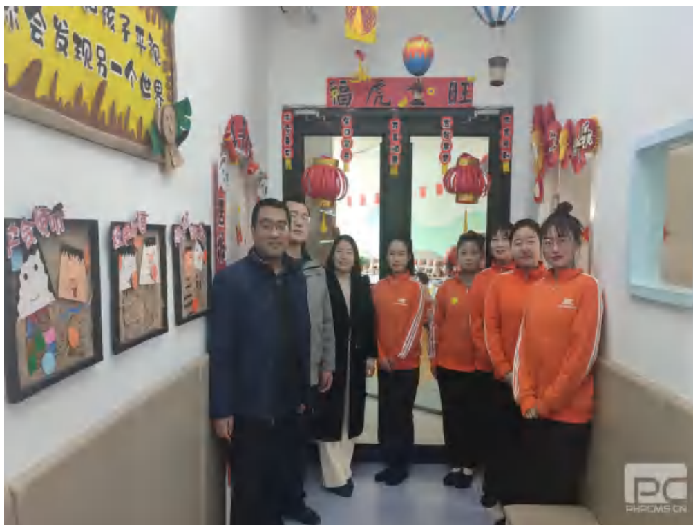
图 29 就业调研 2