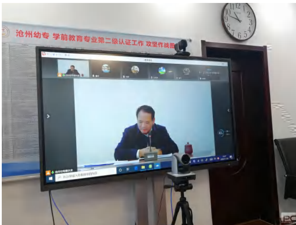
图 33 学校召开重点项目线上推进会