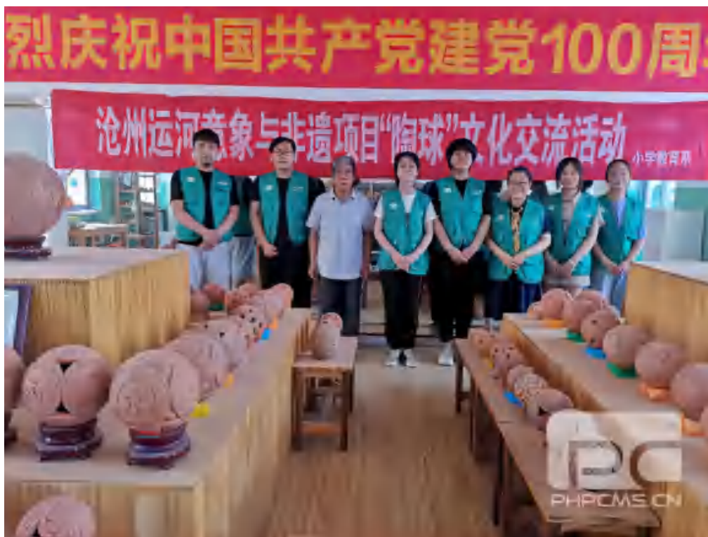
图9 大学生暑假课创活动之雕花陶球

2022年7月11日上午来到沧州印象大运河农业生态文化基地参观交流、洽谈合作，开展第三场大学生暑期科技创新服务活动。为进一步加强合作与交流，运河意象团队为运河生态基地赠送了团队成员精心绘制的原创运河文化绘本。希望两个团队的合作能够为运河文化、运河生态注入新鲜活力，同向同行，合作共赢。