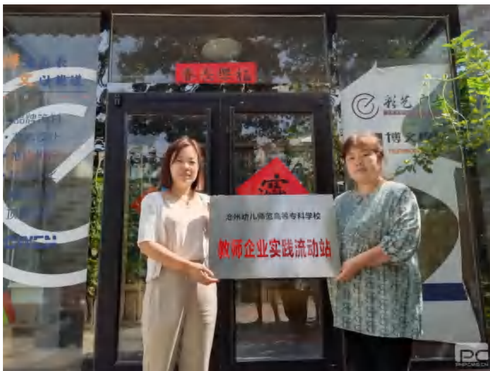
图 21 教师企业流动站