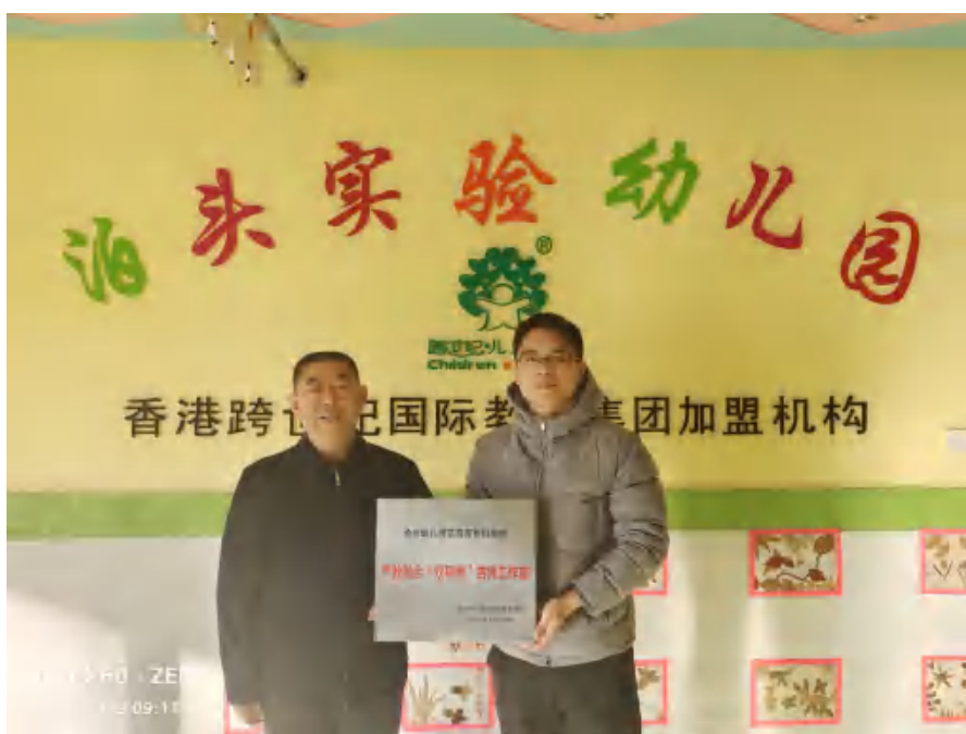
图 20 教师企业流动站挂牌

学校以《职业教育提质培优行动计划(2021-2023年)》和《河北省高等职业教育创新发展行动计划(2012-2025年)》等项目为抓手,积极开展教师企业流动站建设,完善《沧州幼儿师范高等专科学校教师企业流动站建设方案》。2022年学校共签约挂牌教师企业流动站8个,投入建设资金10万元。