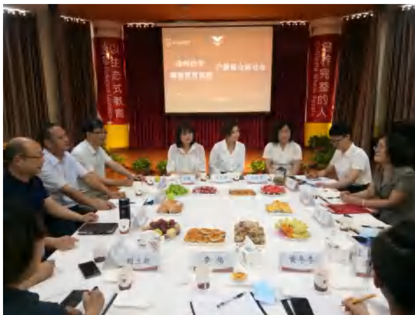
图 18 河北省早教集团会议 1

专业共建机制。利用社会优质资源，校企合作共办专业，解决学校办学专业师资实践经验不足、课程建设滞后幼教事业发展、学生实习就业单位不稳定等问题。与沧州启航幼儿集团等共办早期教育专业。