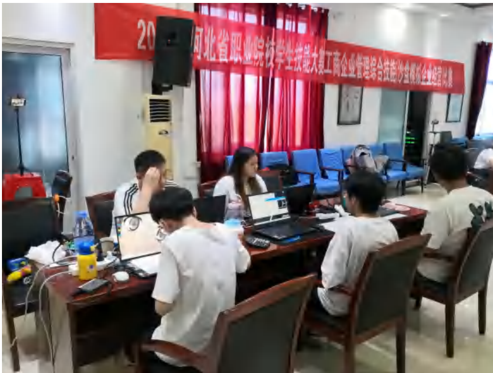
图2 学生技能大赛备赛赛场

同时,校内各系部为促进学生各项素质全面提升,自主组织学生参加各类比赛。如经济管理系举行了“我爱记单词”大赛;小学教育系举办了“等一场花开”抗疫精神主题画展、网络歌手直播大赛。