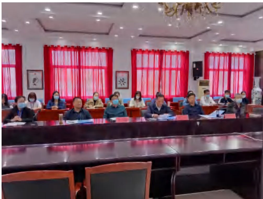
图 23 中芬 ECEC 培训总结大会 1

理念重新编制幼儿园游戏 120 个、项目教学活动方案 60 个，已经融入高职课堂的教学中，接下来会在幼儿园和家庭教育中进一步实践。