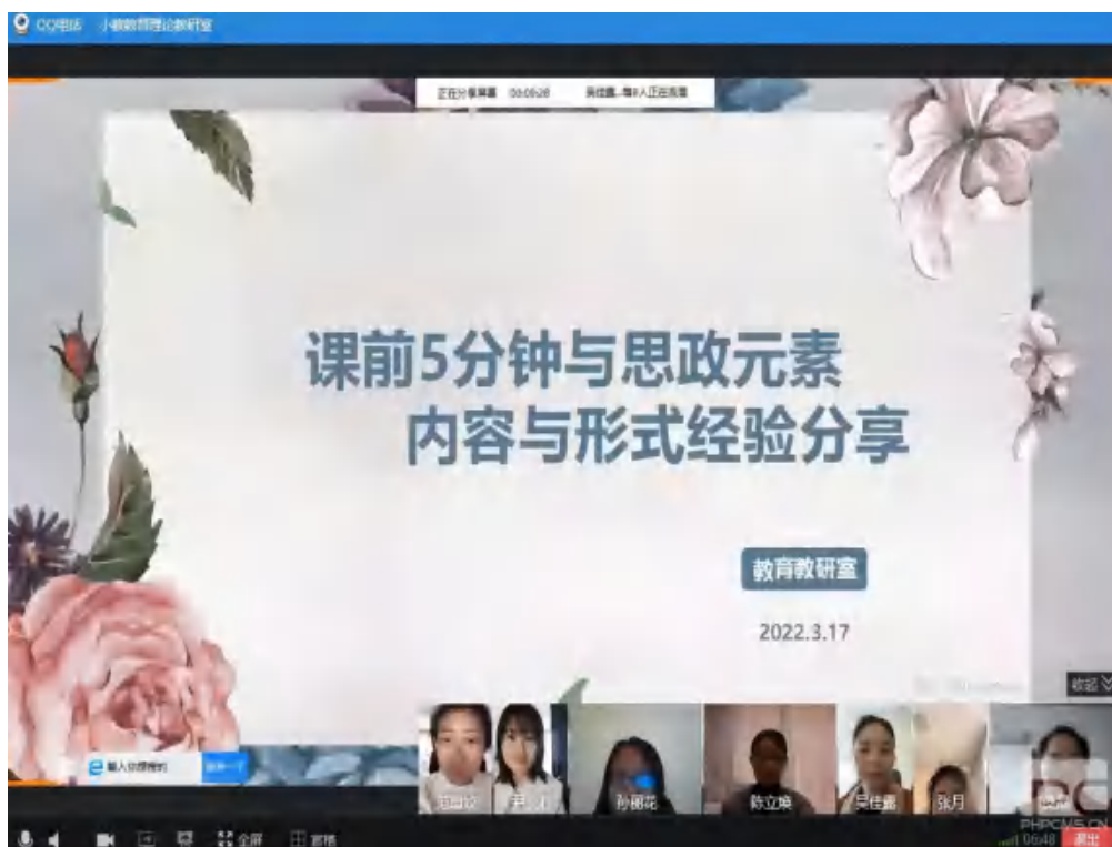
图 15 课程思政

会后，各教研室迅速行动起来，老师们积极搜集资料，精心备课。通过经典作品阅读，引导学生学习先贤遇到挫折不屈不挠的坚强意志，让学生感知中华文化魅力、传承优秀文化、树立文化自信、培养爱国精神。通过加强时事热点的融合，引导学生善于发现生活中的美，积极乐观面对疫情；引导学生心怀感恩，服从防疫大局，自立、自强；通过学习有关防疫的视频，鼓励学生珍惜网课学习的机会，防疫学习两不误。老师们课程思政形式多样，内容融合贴切，立德树人细无声。