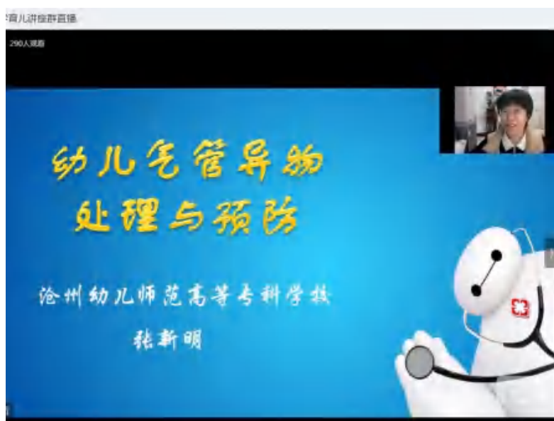
图 27 服务社区，线上公益大讲堂

12月23日晚，教育教研室主任张新明副教授为听众们带来了一场精彩的幼儿气管异物处理与预防公益讲座，涵盖了认识气管异物、处理气管异物和预防气管异物三个方面。