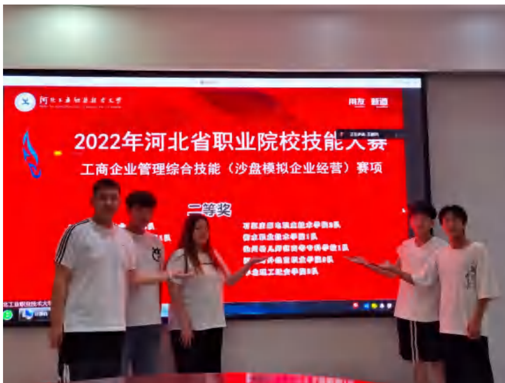
图 1 学生技能大赛获奖

8 月 20 日，学校在由河北省科学技术协会、河北省科学技术厅、河北省教育厅、河北省人力资源和社会保障厅联合组织开展的第三届河北省大学生创新方法大赛中共申报了 4 项作品参赛，其中 3 项作品获得发明制作类（专科）三等奖，1 项作品获得创业类（专科）三等奖。