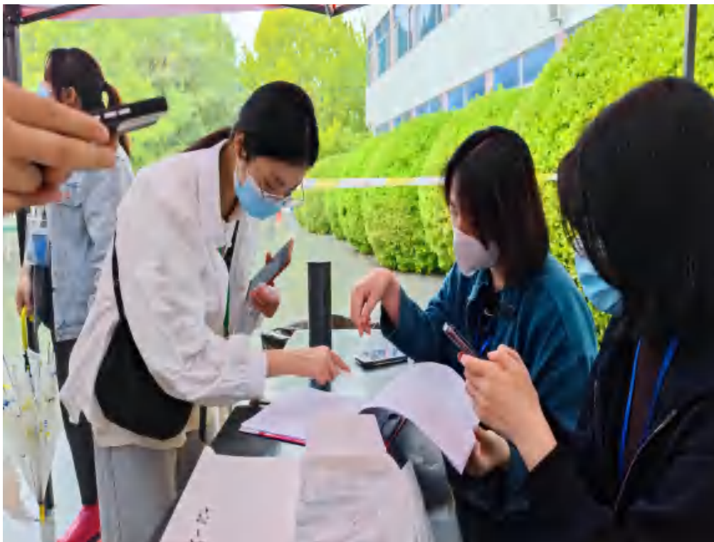
图 12 疫情期间学生返校核酸登记

面对疫情防控工作常态化，经济管理系高度重视返校复学相关工作，严格落实学校各项工作要求，强化责任担当，全力以赴打好疫情防控阻击战，确保全校师生生命健康安全，坚守疫情防控阶段性成果，应势而动，精准细致做好学生返校工作，构筑学院疫情防控严密防线。