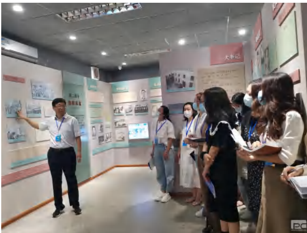
图 3 学前教育系书记讲校史

加，涌现了《甘将心血化时雨》《做一个平凡有爱的老师》《春风榴火燃遍中国》《立德树人守初心 培根铸魂担使命》等一批高质量稿件。这些作品讲述了党的十八大以来的新变化、新发展、新成就，抒发了对新时代美好生活的热爱，描绘了对美好未来的期待以及师生们积极昂扬、努力奋发进取的精神风貌，展现了老师们拼搏奋斗的心路历程和可歌可泣的事迹。学前教育系组织 2022 级全体学生开展了“献礼二十大，奋进新征程”主题活动，通过歌曲演唱、舞蹈表演、情景剧表演、讲故事、书画丹青等多种形式，抒发同学们知党、爱党、颂党的真挚情感，表达永远跟党走信念和决心。活动开展以来，学前教育系党总支积极动员、认真组织，同学们积极参加。在对各班提交的 93 份作品进行初步筛选、充分推优的基础上，最终 24 份作品参与决赛评选。