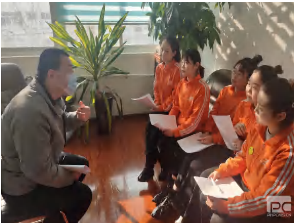
图 28 就业调研 1

此次用人单位访谈和毕业生就业跟踪调研,使学前教育专业精准对接用人需求,有利于深化教育教学改革,创新思想政治工作方式方法,切实推进学校毕业生就业质量提升。