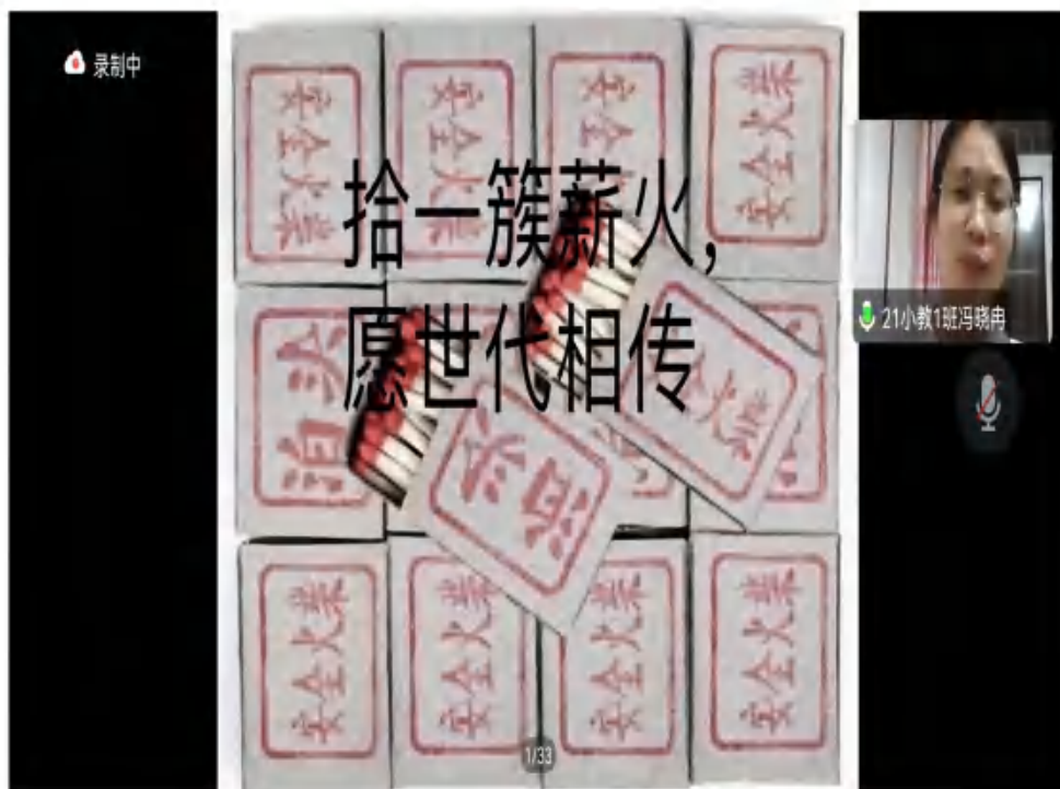
图 5 非遗传承·薪火相传 2

首先，陈老师以大学生创新创业为切入点介绍了大学生创新创业的重要性。随后，小学教育专业 20-4 班邓皓匀，20-7 班王凤新，21-9 班谢燃燃，21-1 班冯晓冉，21-1 班韩越五名同学分别以视频、演讲等形式，分享了泊头火柴非遗文化的科普知识，深入介绍了泊头火柴的兴衰发展史，同时从“非遗”与“科技”结合的视角探究“非遗·火柴文化”在现代互联网时代发展的机遇和模式。最后，“沧有乔木”团队以“‘非遗·火柴文化’传承”为主题发起有奖作品征集活动。征集作品形式不限，充分调动学生主观创新性，期待“非遗·火柴文化”在学生们作品中焕发新的生命和色彩。同时也期待更多新成员加入团队，为大力宣传“非遗文化”添砖加瓦。