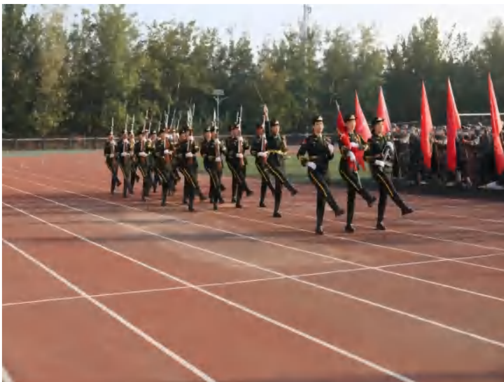
图 7 军训队列式

军训是新生入学的第一课，对于增强新时代青年大学生的身体素质，更好地投入到大学校园生活有重要的意义。学校党委历来高度重视、科学规划、周密部署军训工作。相信 2022 级新同学将以饱满的热情、昂扬的斗志投入到军训和全新的大学生活中，把爱党、爱国、爱人民的伟大情怀深深植根于内心，以良好的精神面貌展现青年大学生的风采，以奋发向上的实际行动向中国共产党第二十次全国代表大会献礼。